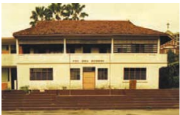
1988年的培华学校。

根据 schoolbell.sg 的统计，培华长老会小学以 255% 的热门度居 2022 年新加坡小学榜首。