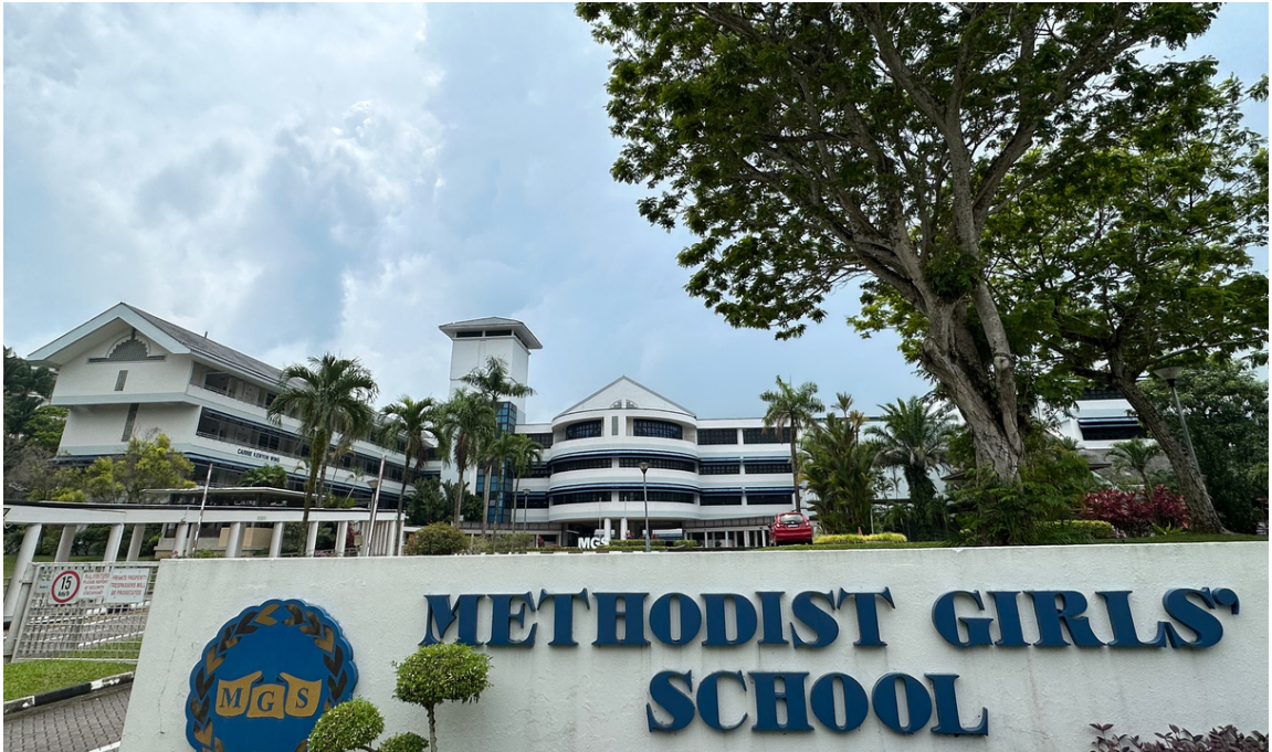
【青麓尚居】连通美世界地铁站，距位于阿尔伯王园地铁站的美以美女子学校仅1公里。

本地名校学府附近的房子一直是投资者和家长们的首选。为了得到名校入取的名额，绝大多数家长会选择在名校附近租房或买房来提高入校的机率。