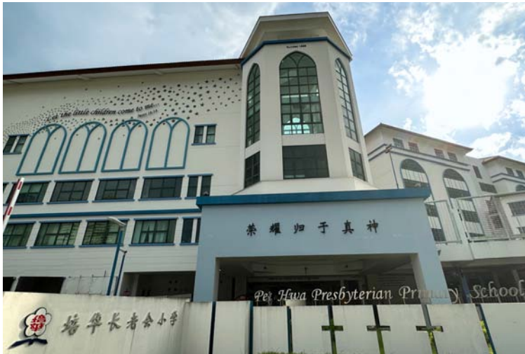
【青麓尚居】建有人行天桥从二楼直达培华长老会小学旁的社区活动中心。